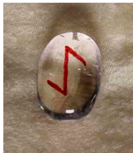
Runen Eihwaz.

han meg og reiser seg opp til stående. Jeg ligger fremdeles på madrassen på gulvet og lytter til den messende stemmen. Han utfører et gammelt runeritual.