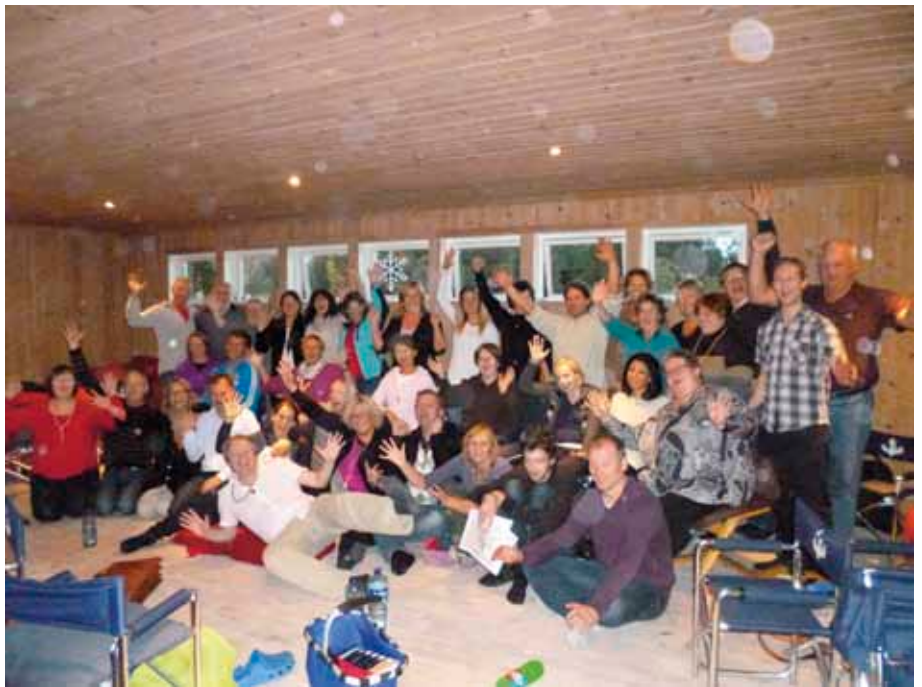
Fra ett av seminarene. Sjekk alle orbene!