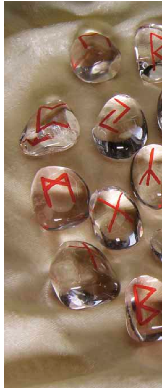
Magiske runekrefter.

- Du har også et skjevt bekken, sier han